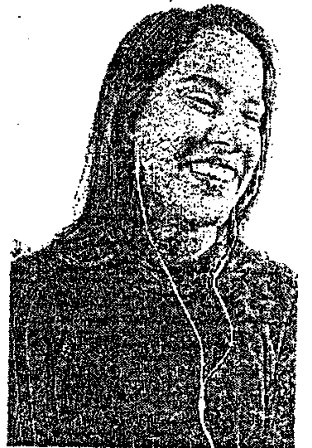
Raquel também fez críticas a Bolsonaro

a candidatura do presidente Lula ou do presidente Bolsonaro para tentar chegar ao segundo turno". No estado, o alvo da pré-candidata é o PSB. "A gente vive hoje um momento muito ruim e nós continuamos com o governador do PSB. Não é porque vai mudar presidente que o PSB vai fazer um governo melhor do que fez", disse. Na avaliação da tucana, Paulo Câmara conduz "a pior gestão da história de Pernambuco, "que não consegue enxergar para além da próxima eleição", encerrou.