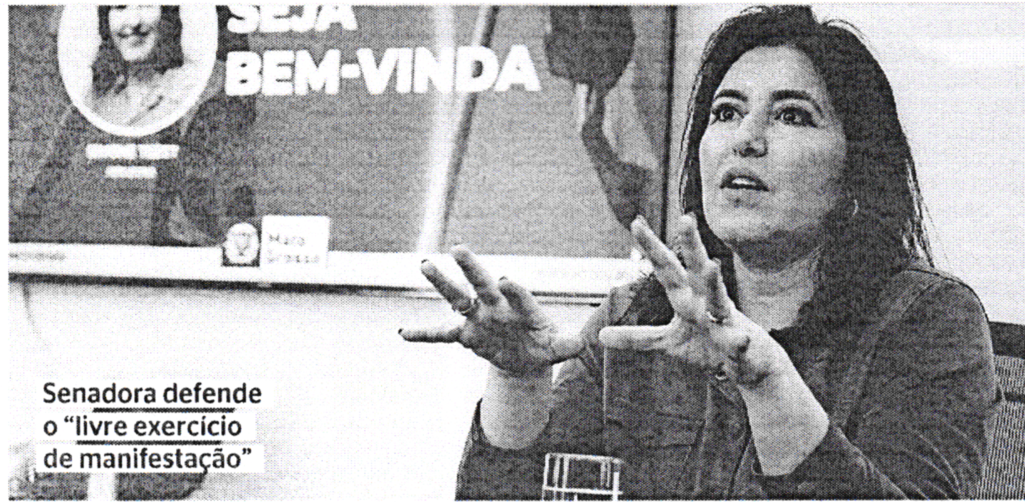
Senadora defende o "livre exercício de manifestação"

O diagnóstico dos partidos do autodenominado centro democrático aponta que, assim com em 2018, o processo eleitoral deste ano vem registrando "episódios muito preocupantes de agressividade e violência" e que "a manu-