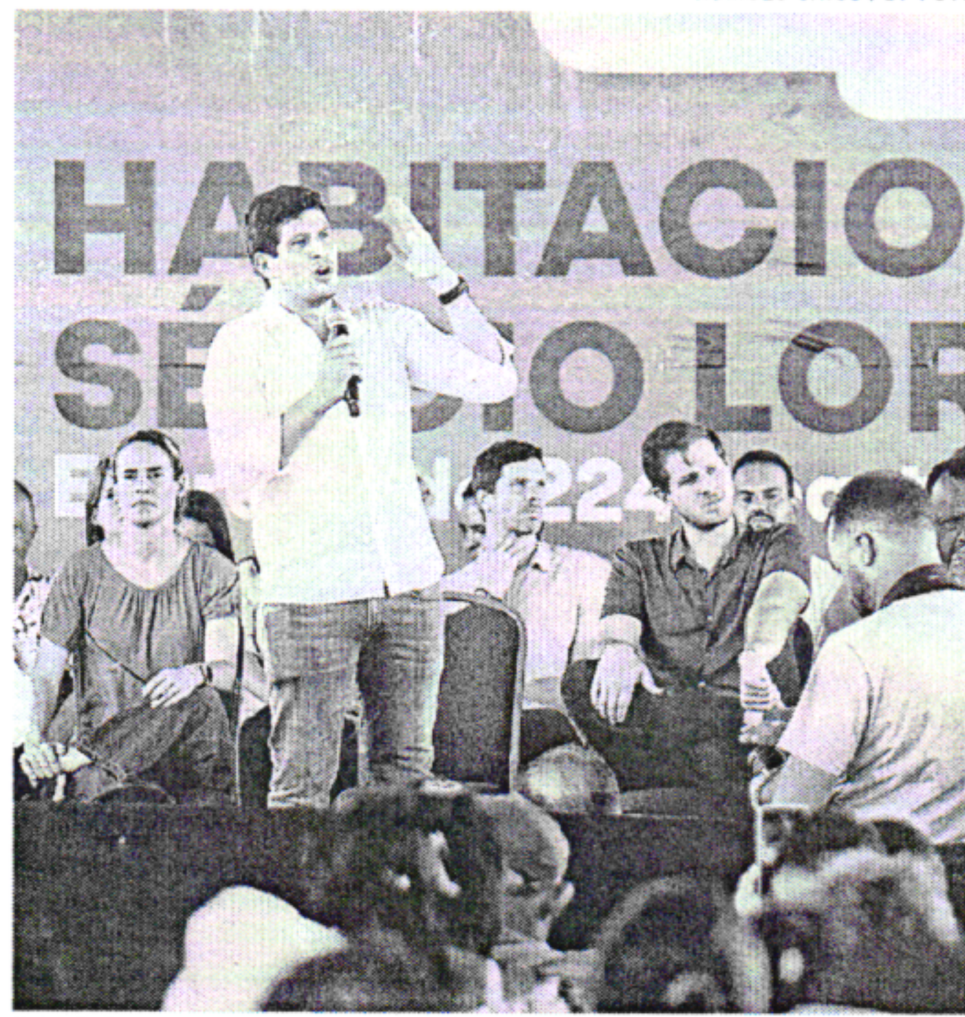
Prefeitura do Recife disse que vai bancar as mudanças

Os idosos e pessoas com deficiência foram priorizados com apartamentos nos imóveis nos andares inferiores