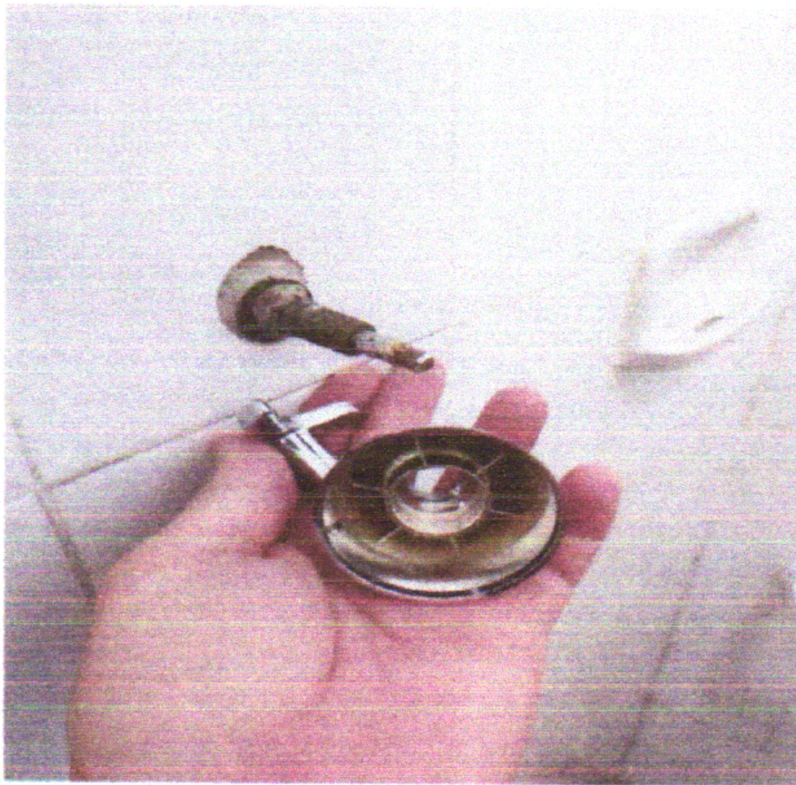
Torneiras de Passagem