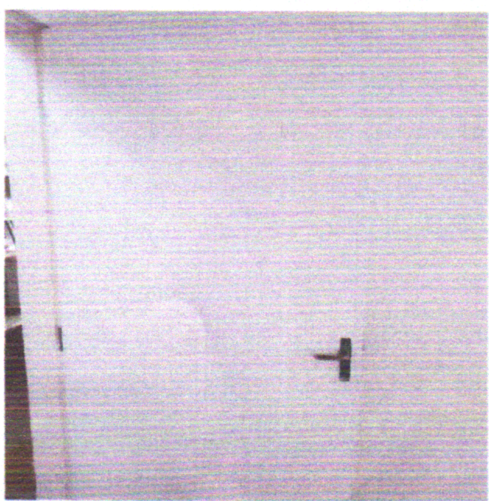
Colocação de Portas