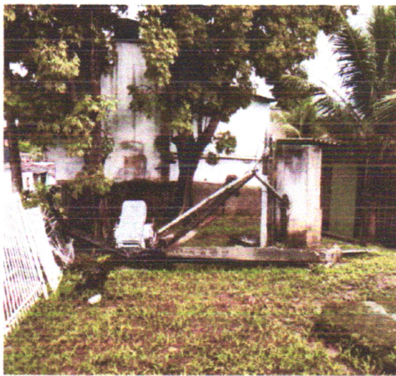
Subestação Aérea Danificada