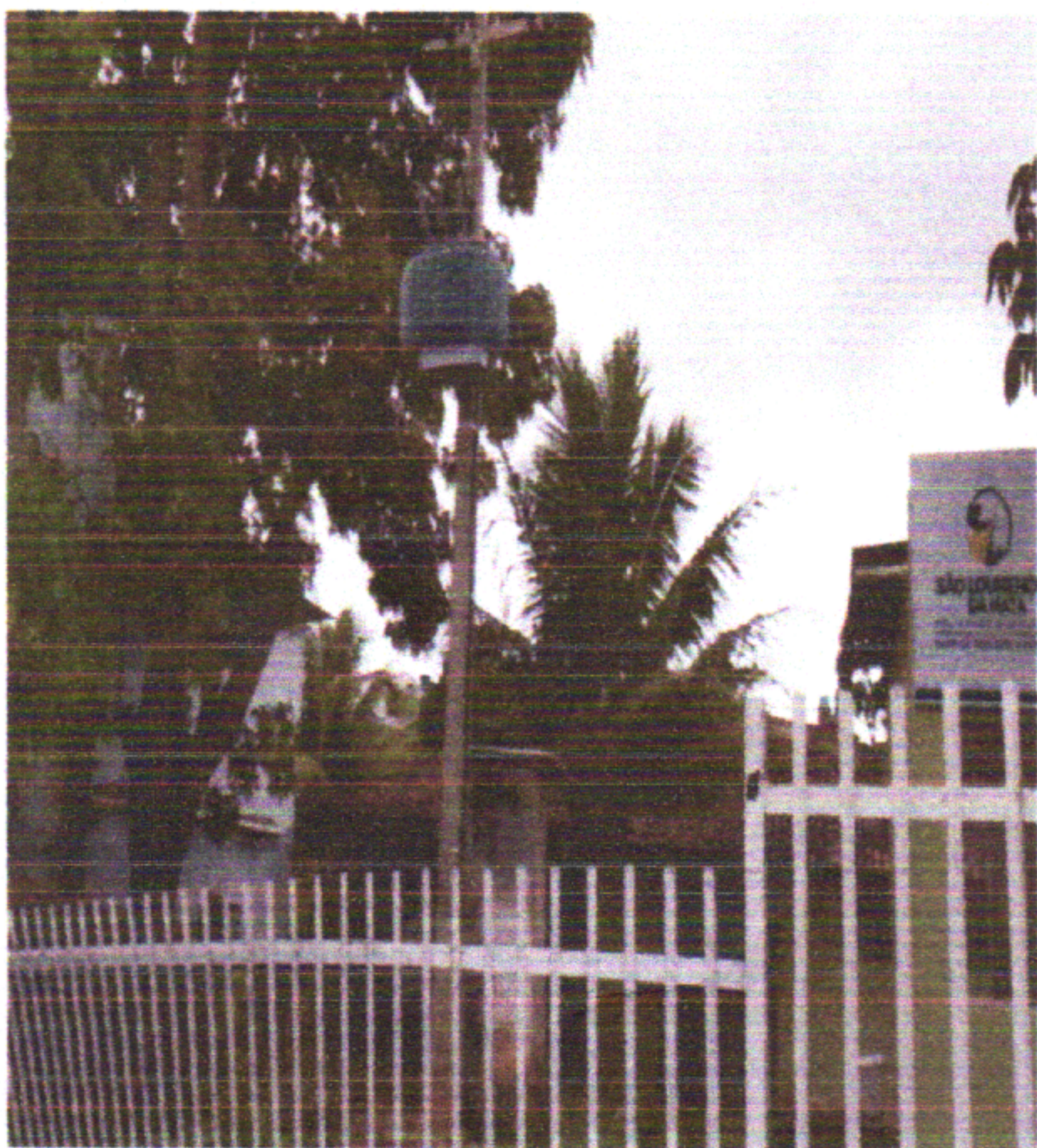
Subestação Aérea Substituída