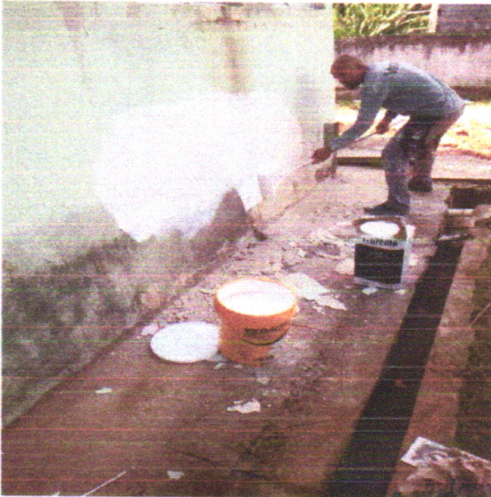
Aplicação de Impermeabilizante Fachada