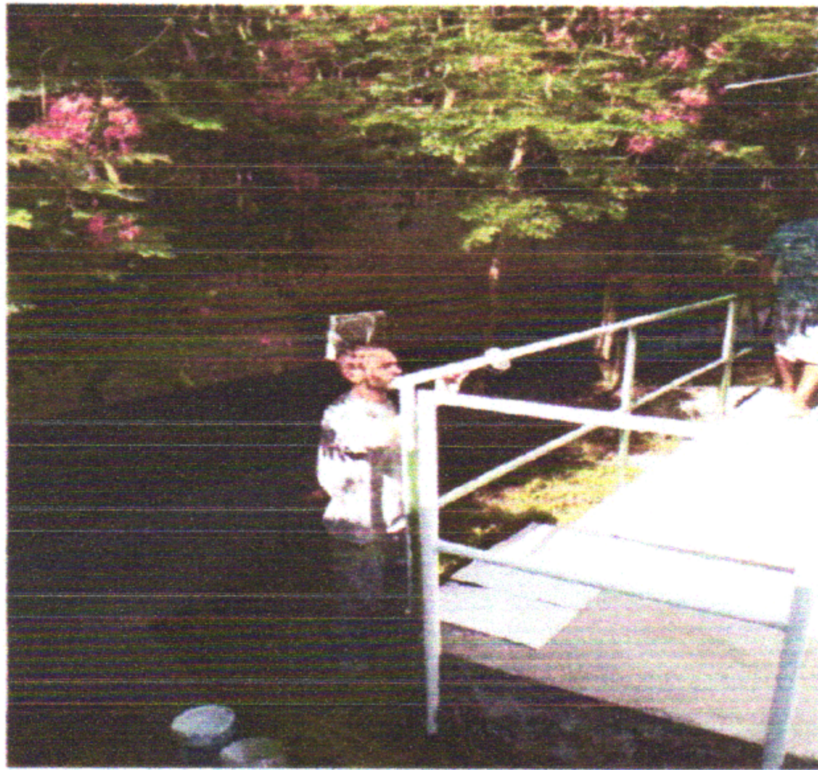
Pintura Gradil Externo