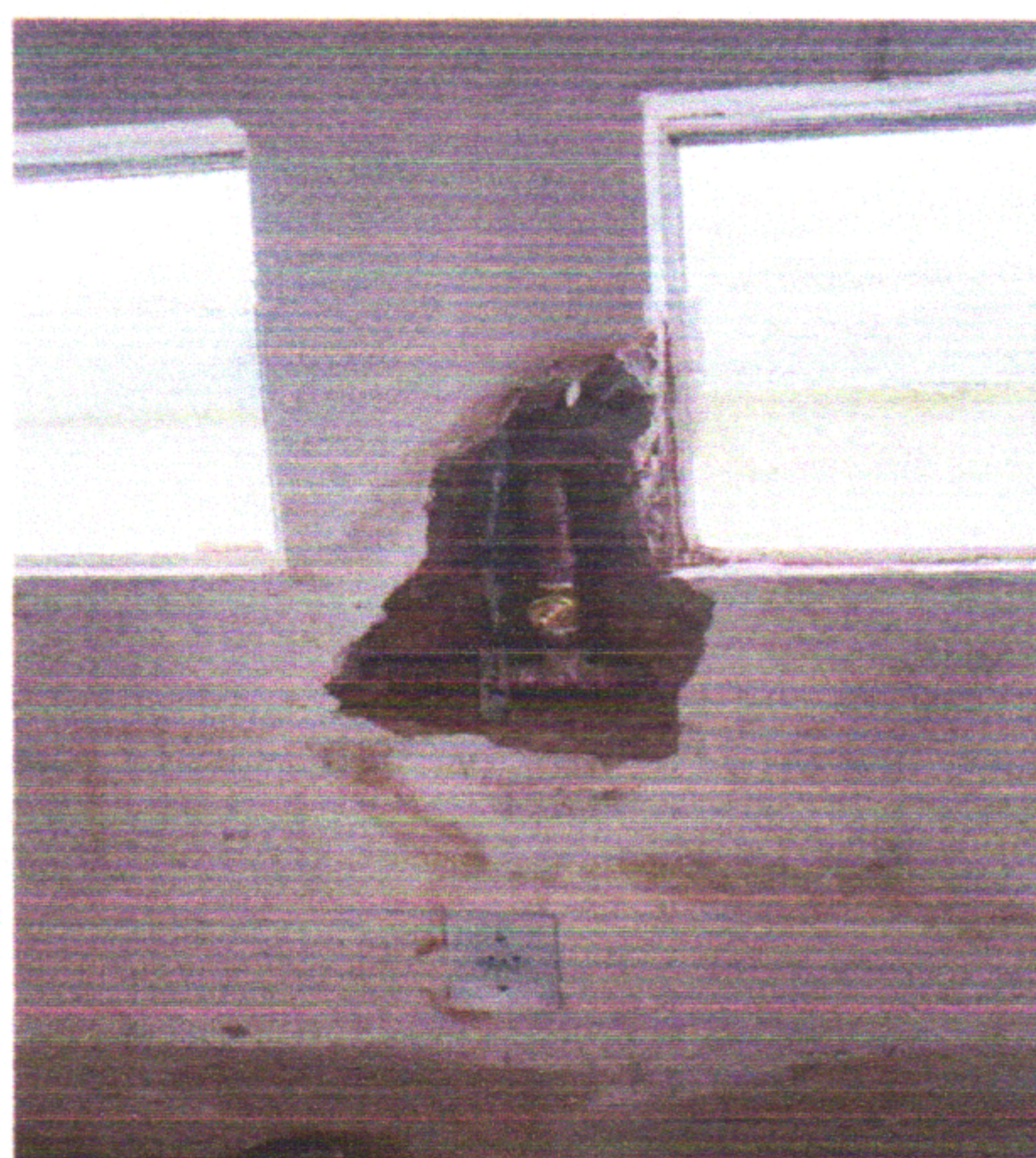
Substituição de Torneiras de Passagem

Diego Alves Engº Civil CREA - 1818446316 PE