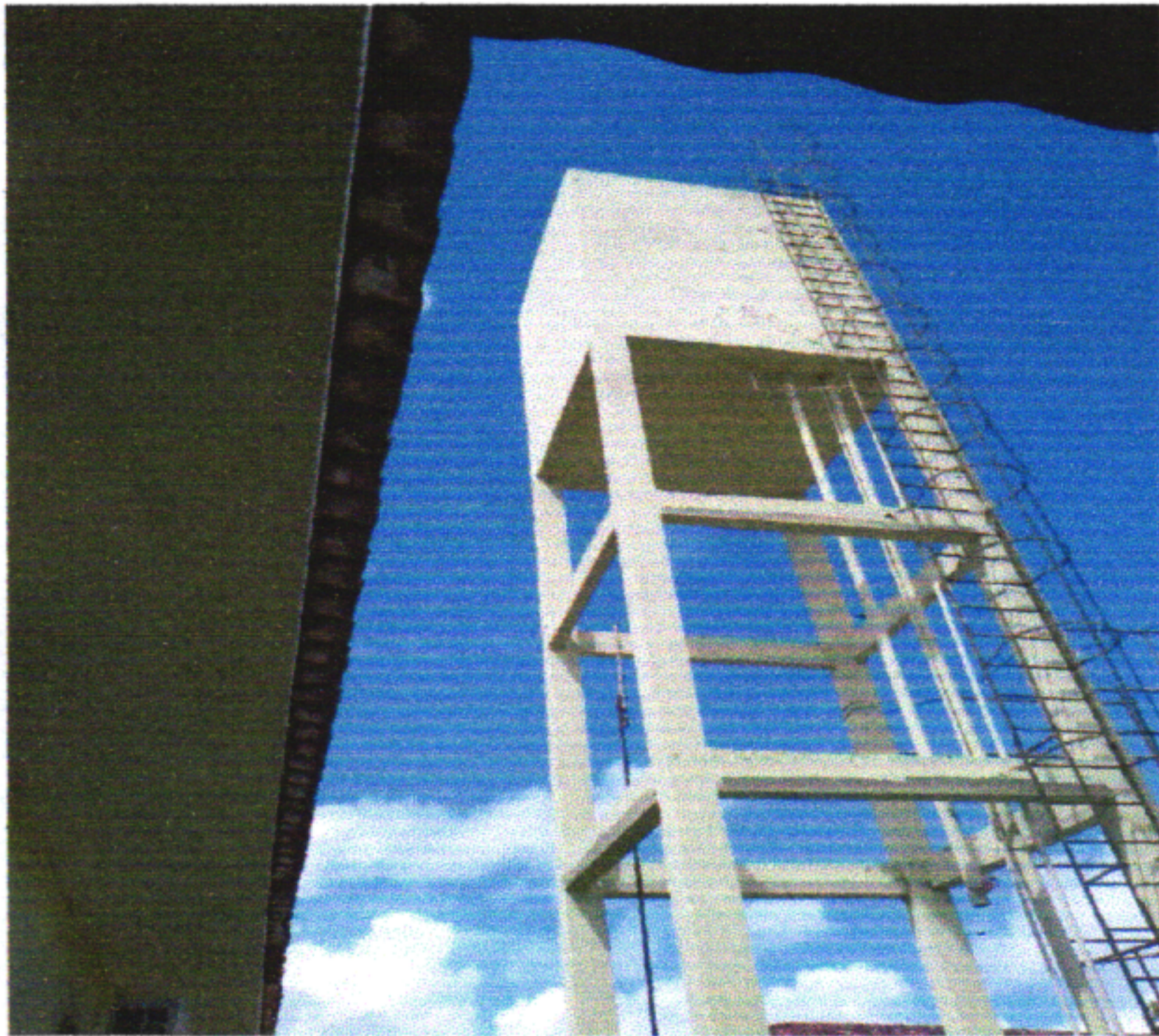
Recuperação e Pintura do Castelo D'água