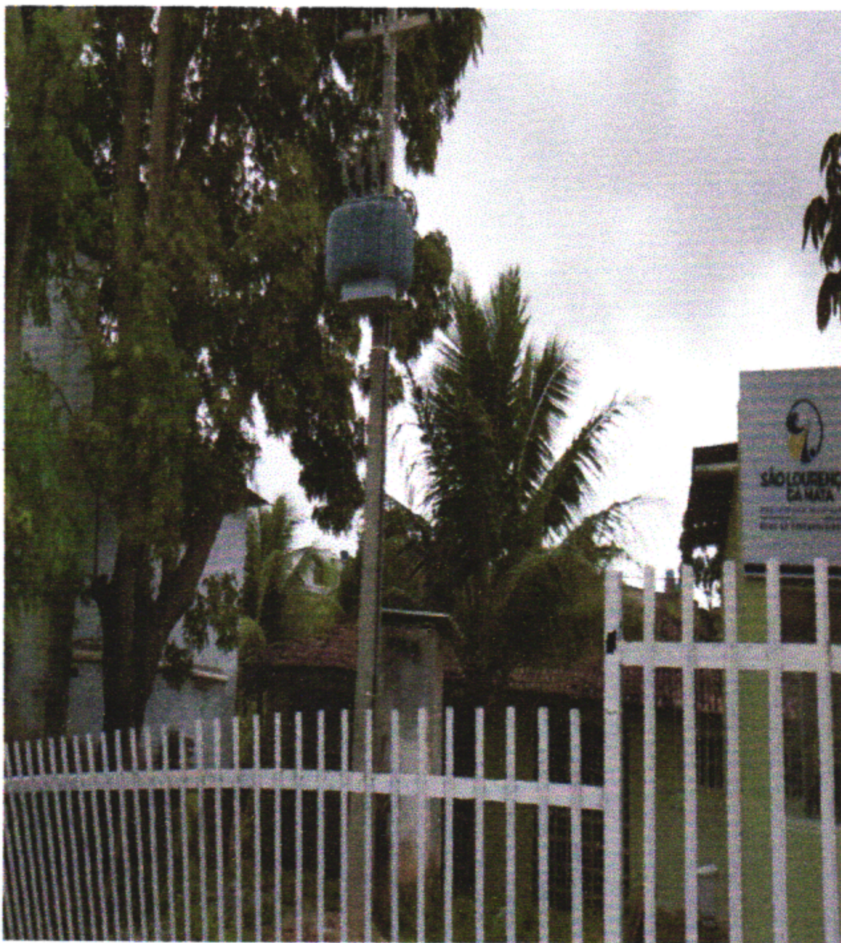
Subestação Aérea Substituída