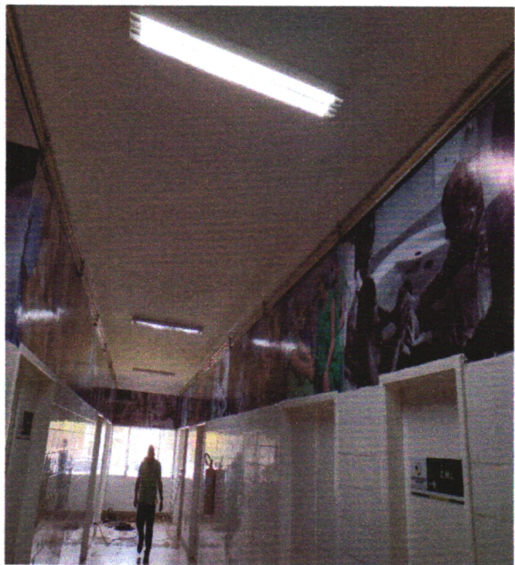
Adesivos Clínica Médica