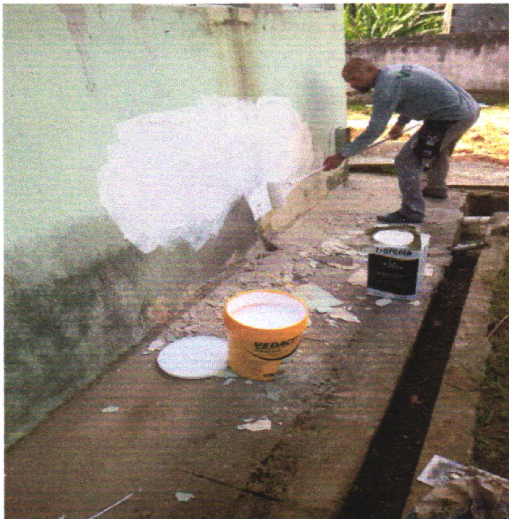
Aplicação de Impermeabilizante Fachada