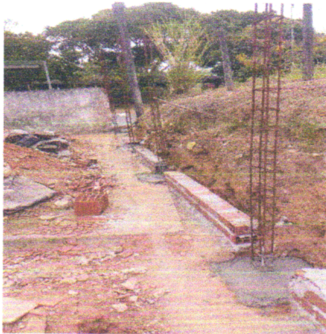
ESCAVAÇÃO PARA CINTA