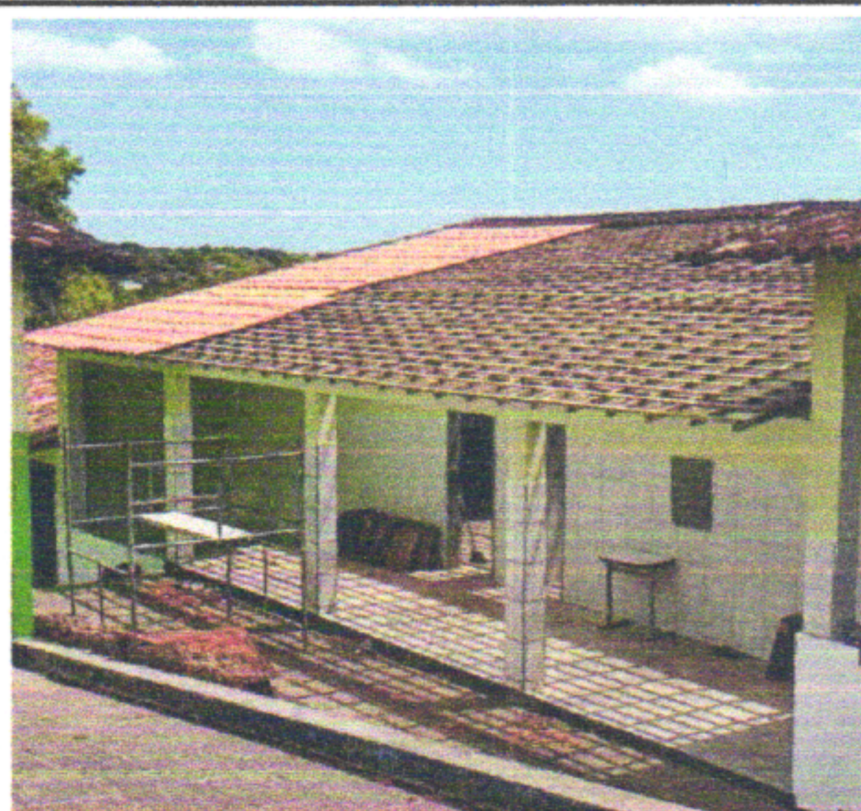
COLOCAÇÃO DE TELHAS CANAL