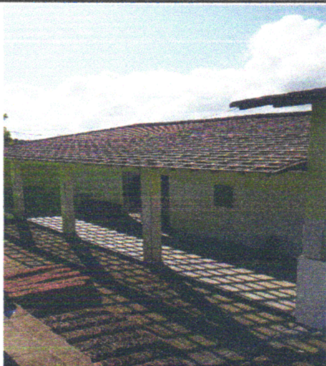
RETIRADA TELHAS CANAL