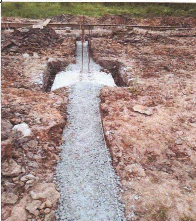
ESCAVAÇÃO ACERTO DO TERRENO E CONCRETO MAGRO