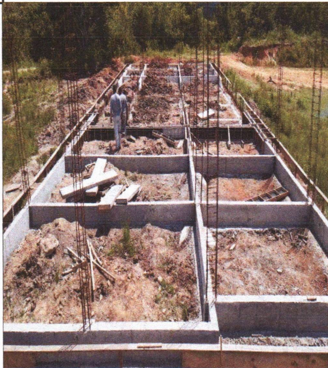
ARMAÇÃO FÔRMA E CONCRETAGEM