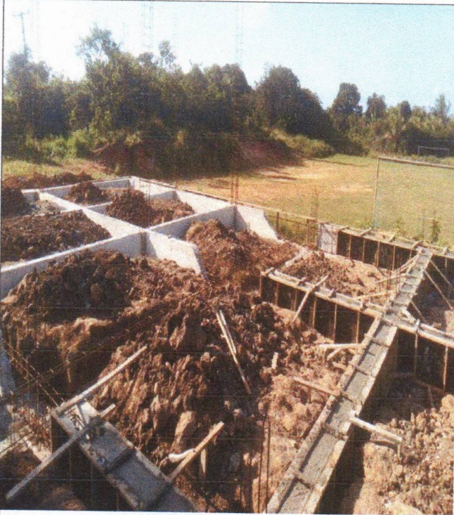
ARMAÇÃO FÔRMA E CONCRETAGEM