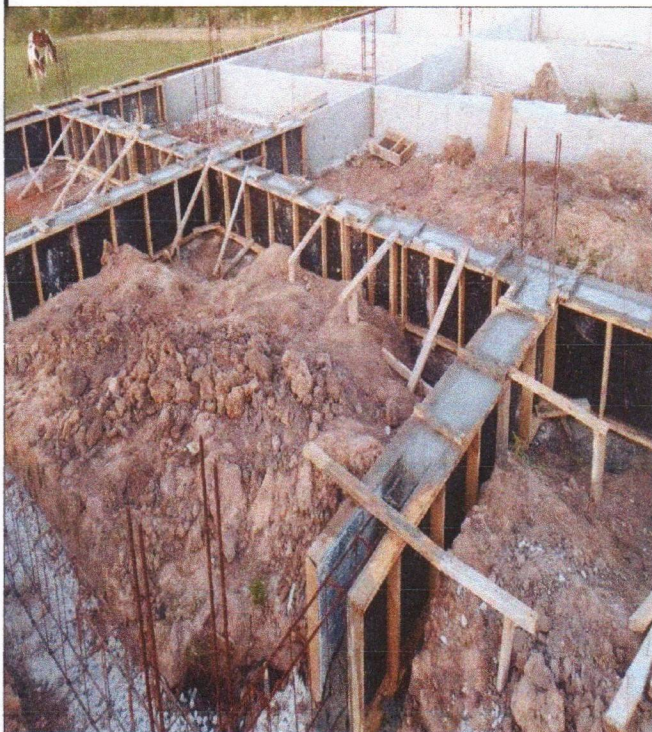
ARMAÇÃO FÔRMA E CONCRETAGEM