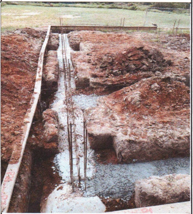
ESCAVAÇÃO ACERTO DO TERRENO E CONCRETO MAGRO