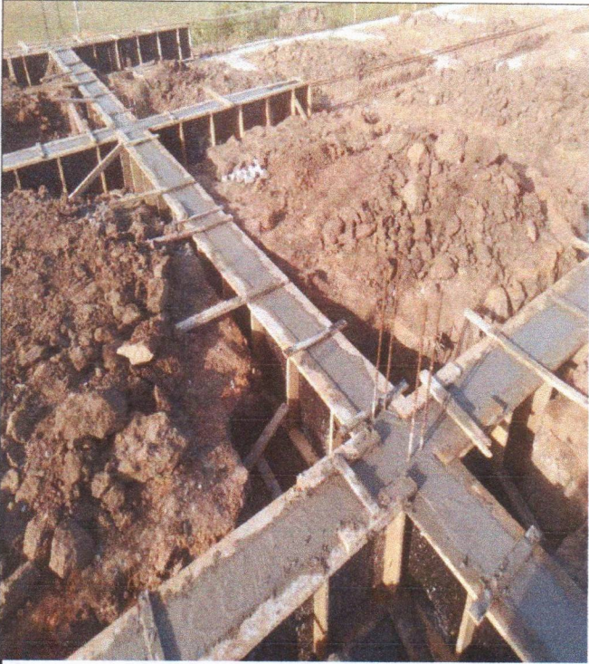
ARMAÇÃO FÔRMA E CONCRETAGEM