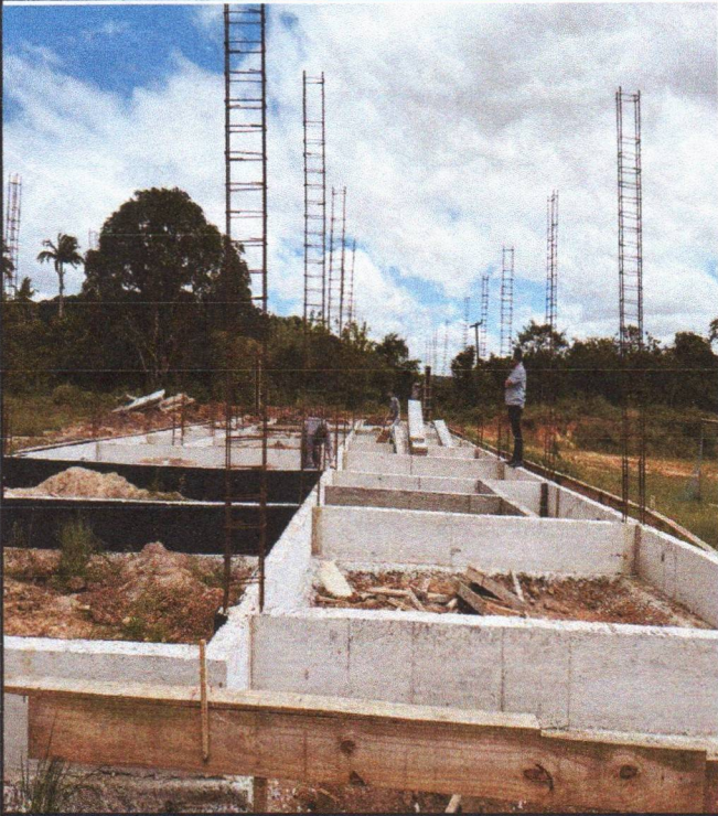
ARMAÇÃO FÔRMA E CONCRETAGEM