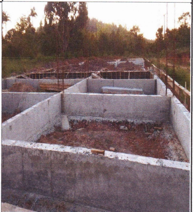
ARMAÇÃO FÔRMA E CONCRETAGEM