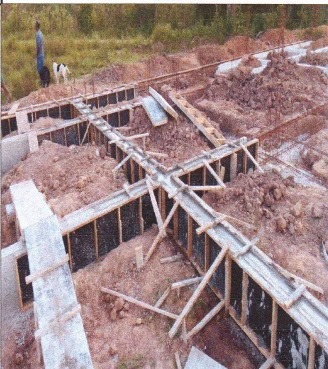
ARMAÇÃO FÔRMA E CONCRETAGEM