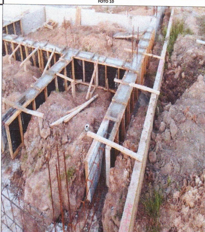
ARMAÇÃO FÔRMA E CONCRETAGEM