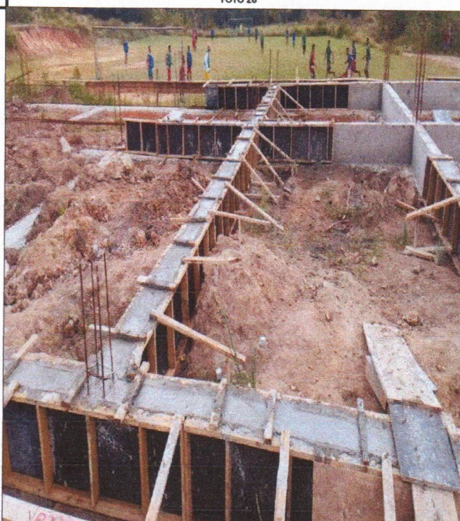
ARMAÇÃO FÔRMA E CONCRETAGEM