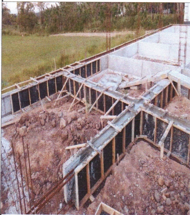
ARMAÇÃO FÔRMA E CONCRETAGEM