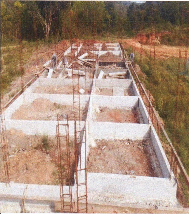
ARMAÇÃO FÔRMA E CONCRETAGEM