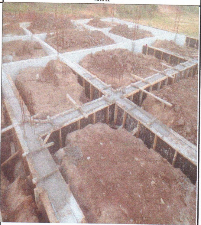
ARMAÇÃO FÔRMA E CONCRETAGEM