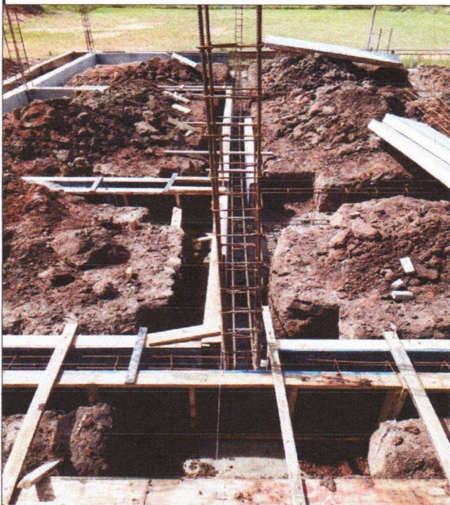
ARMAÇÃO FÔRMA E CONCRETAGEM