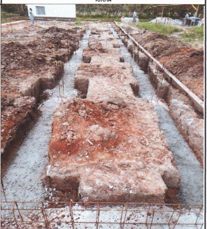
ESCAVAÇÃO ACERTO DO TERRENO E CONCRETO MAGRO