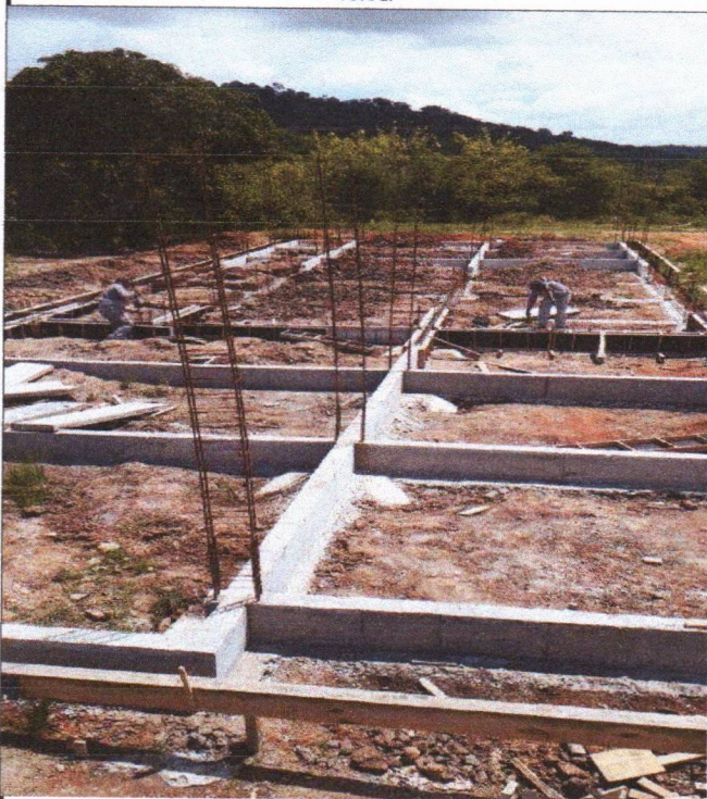
ARMAÇÃO FÔRMA E CONCRETAGEM