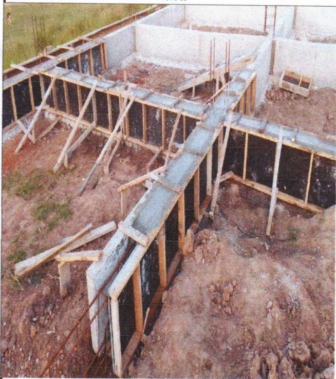
ARMAÇÃO FÔRMA E CONCRETAGEM