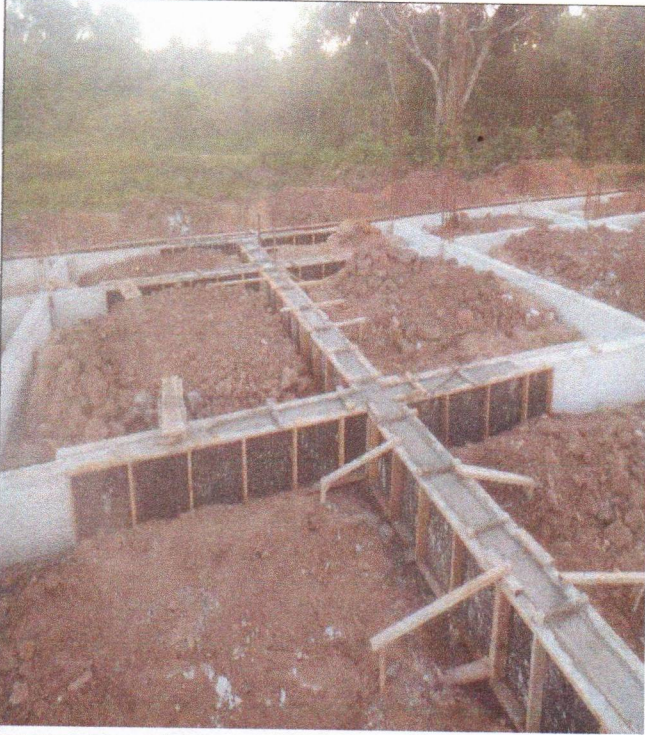
ARMAÇÃO FÔRMA E CONCRETAGEM