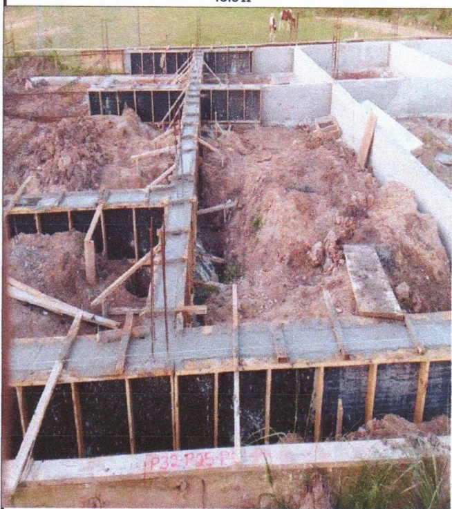
ARMAÇÃO FÔRMA E CONCRETAGEM