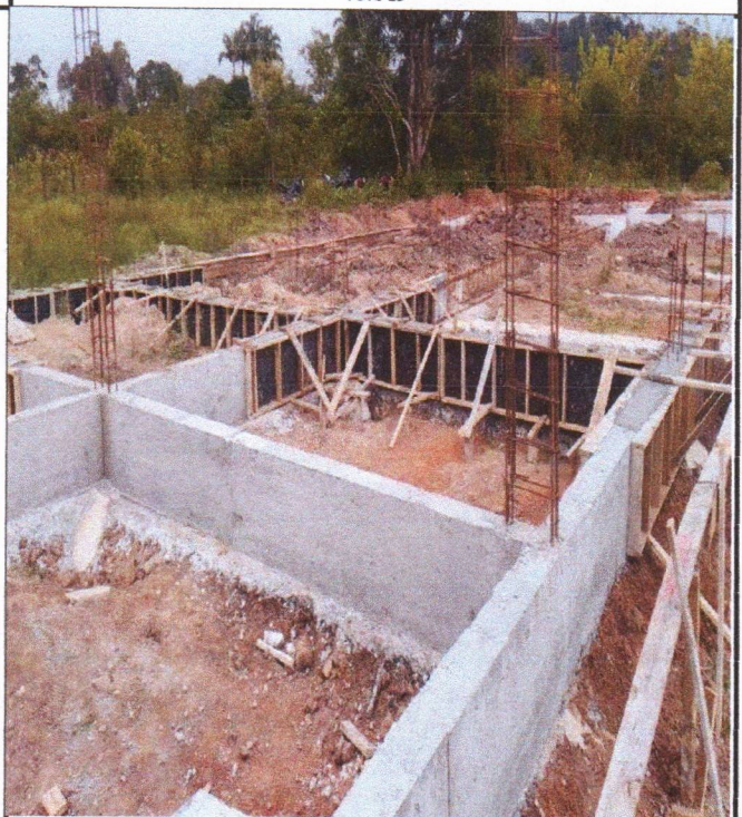
ARMAÇÃO FÔRMA E CONCRETAGEM