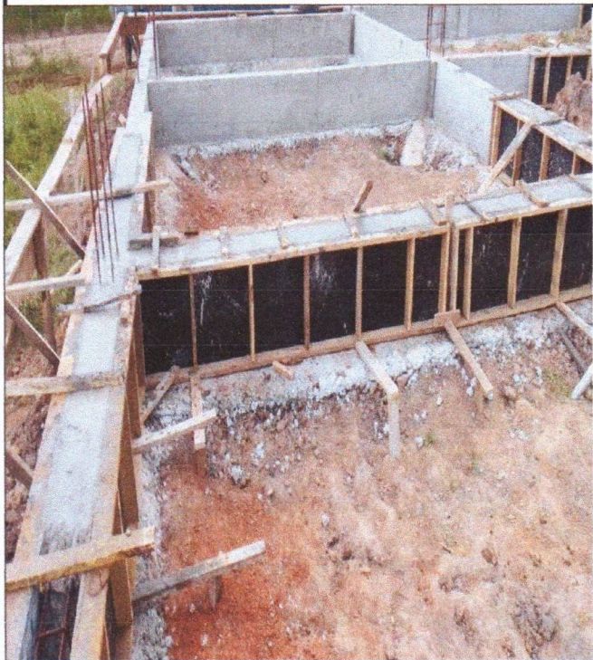
ARMAÇÃO FÔRMA E CONCRETAGEM