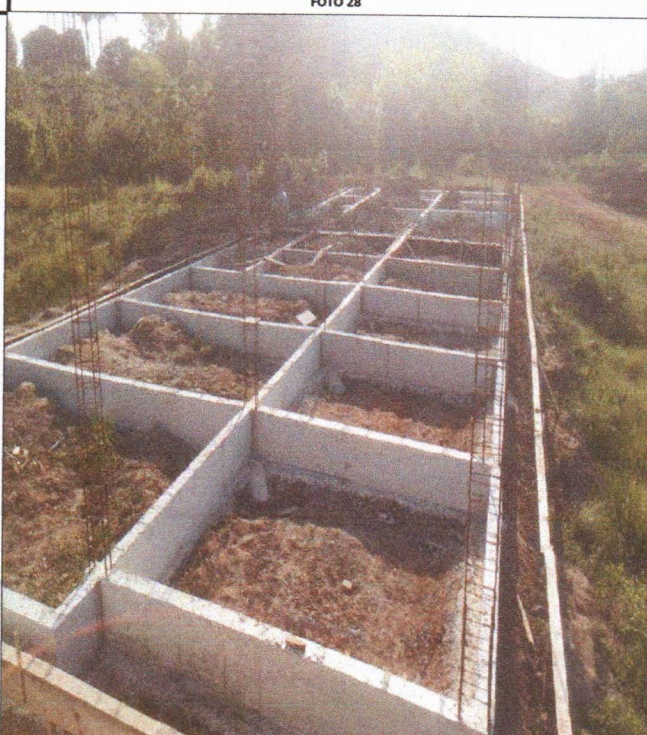
ARMAÇÃO FÔRMA E CONCRETAGEM