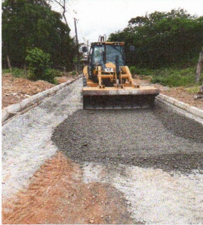
RUA CAROLINE BORBA DE LIMA