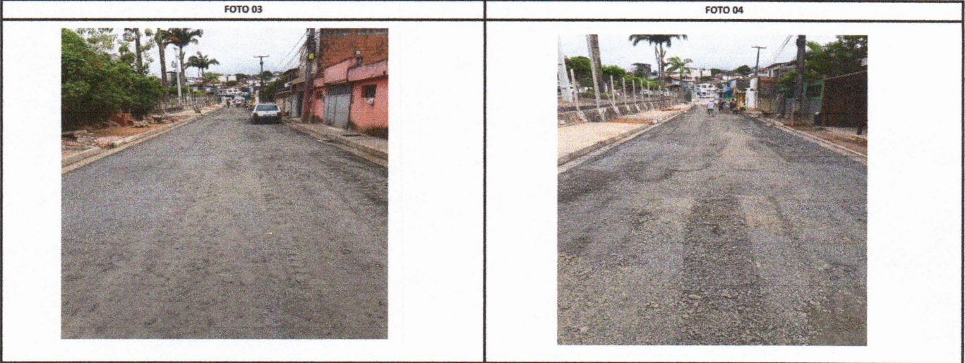
RUA CAROLINE BORBA DE LIMA