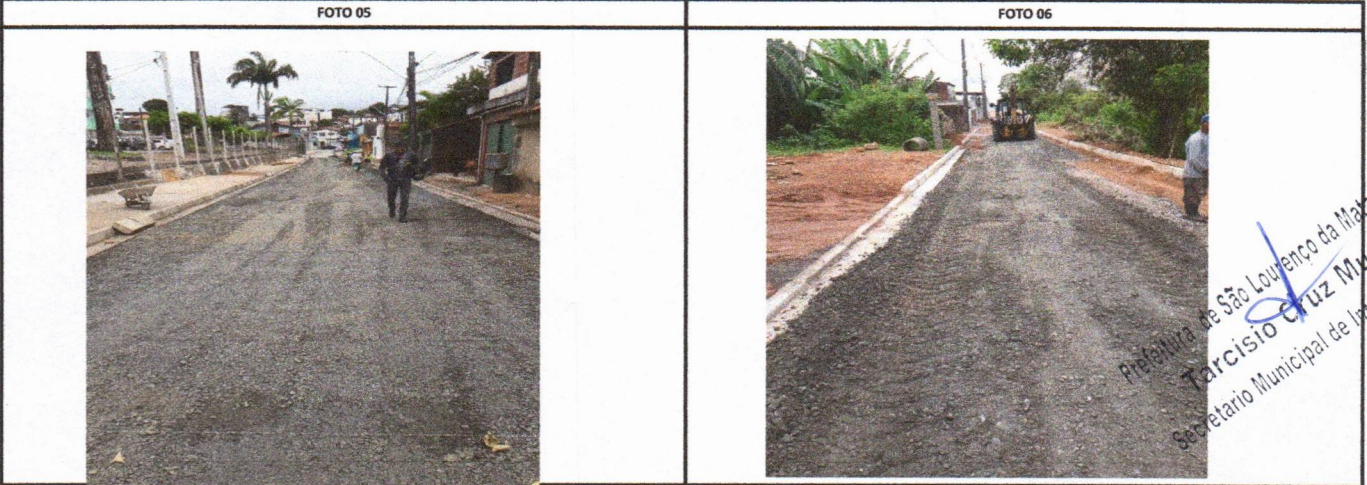
RUA CAROLINE BORBA DE LIMA