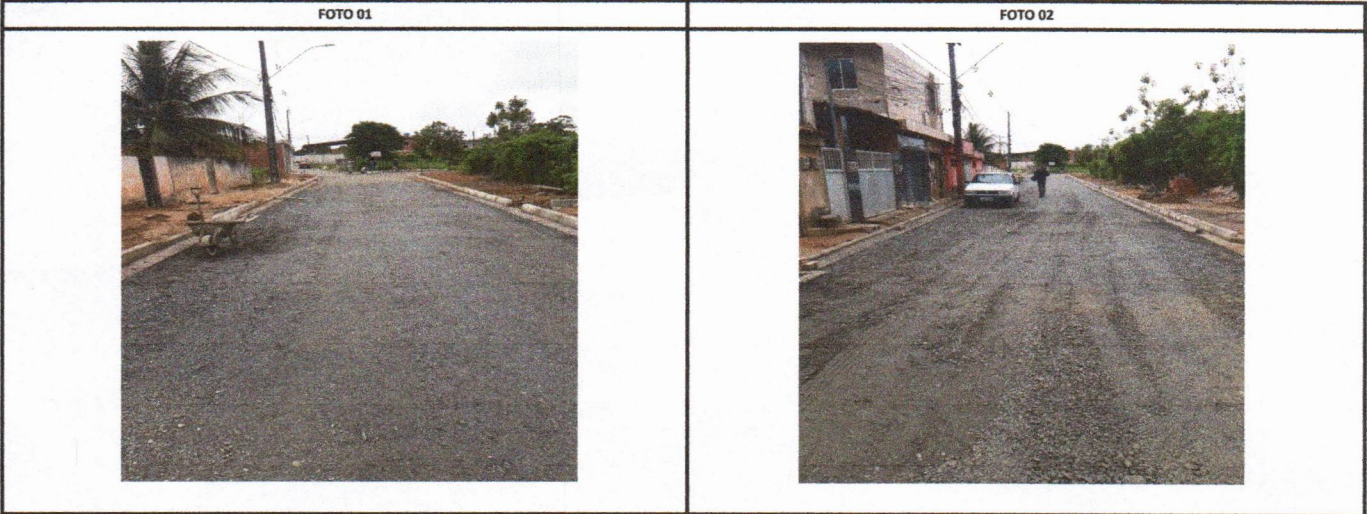
RUA CAROLINE BORBA DE LIMA