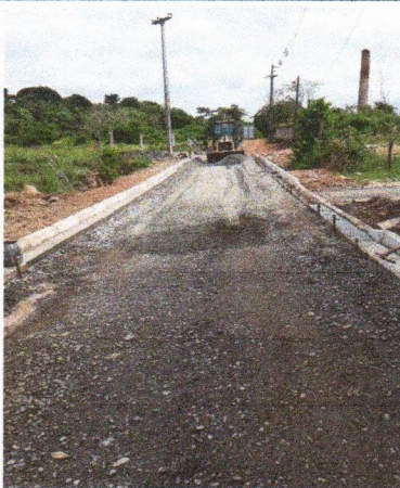
RUA CAROLINE BORBA DE LIMA