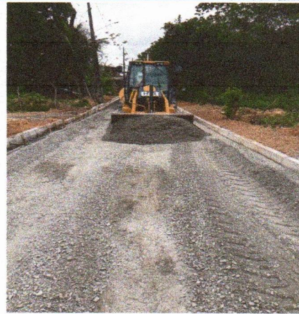
RUA CAROLINE BORBA DE LIMA