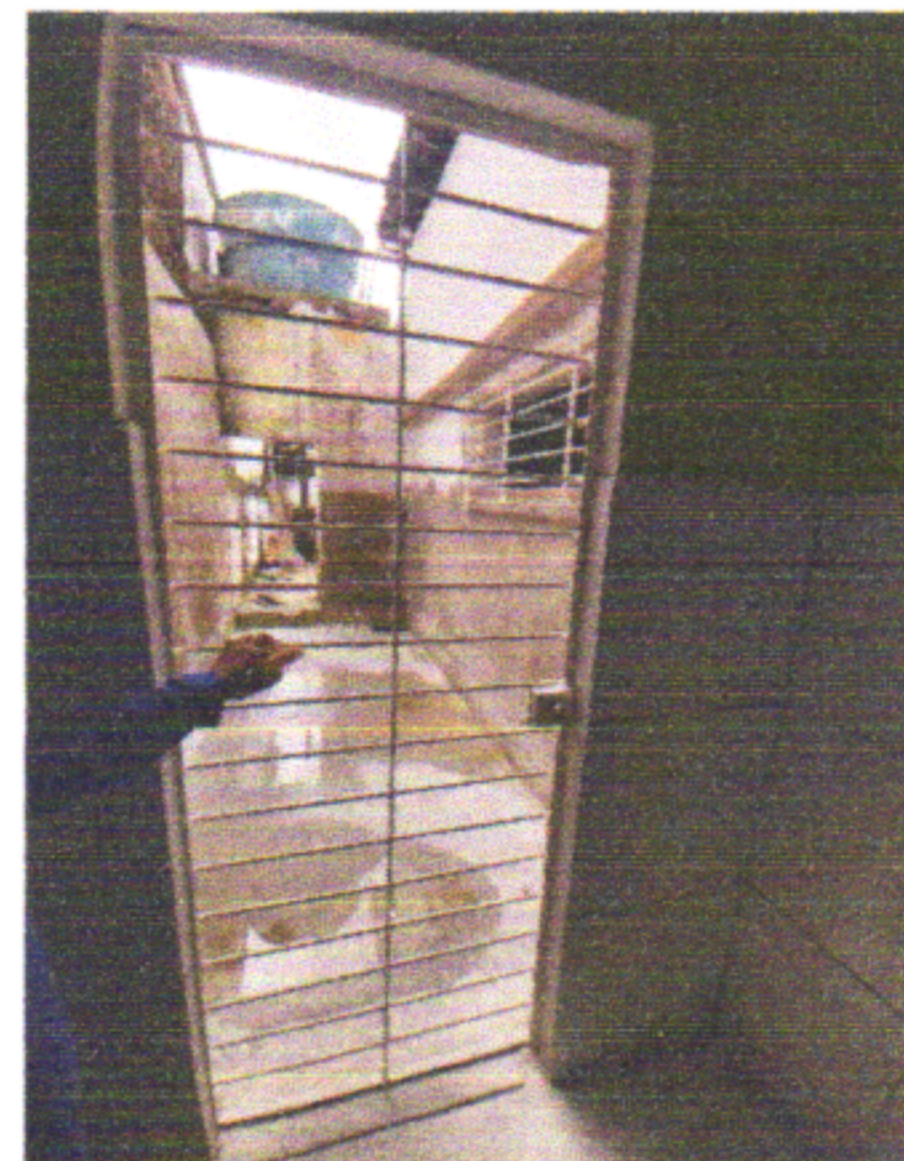
PINTURA EM ESMALTE SOBRE SUPERFÍCIE METÁLICA