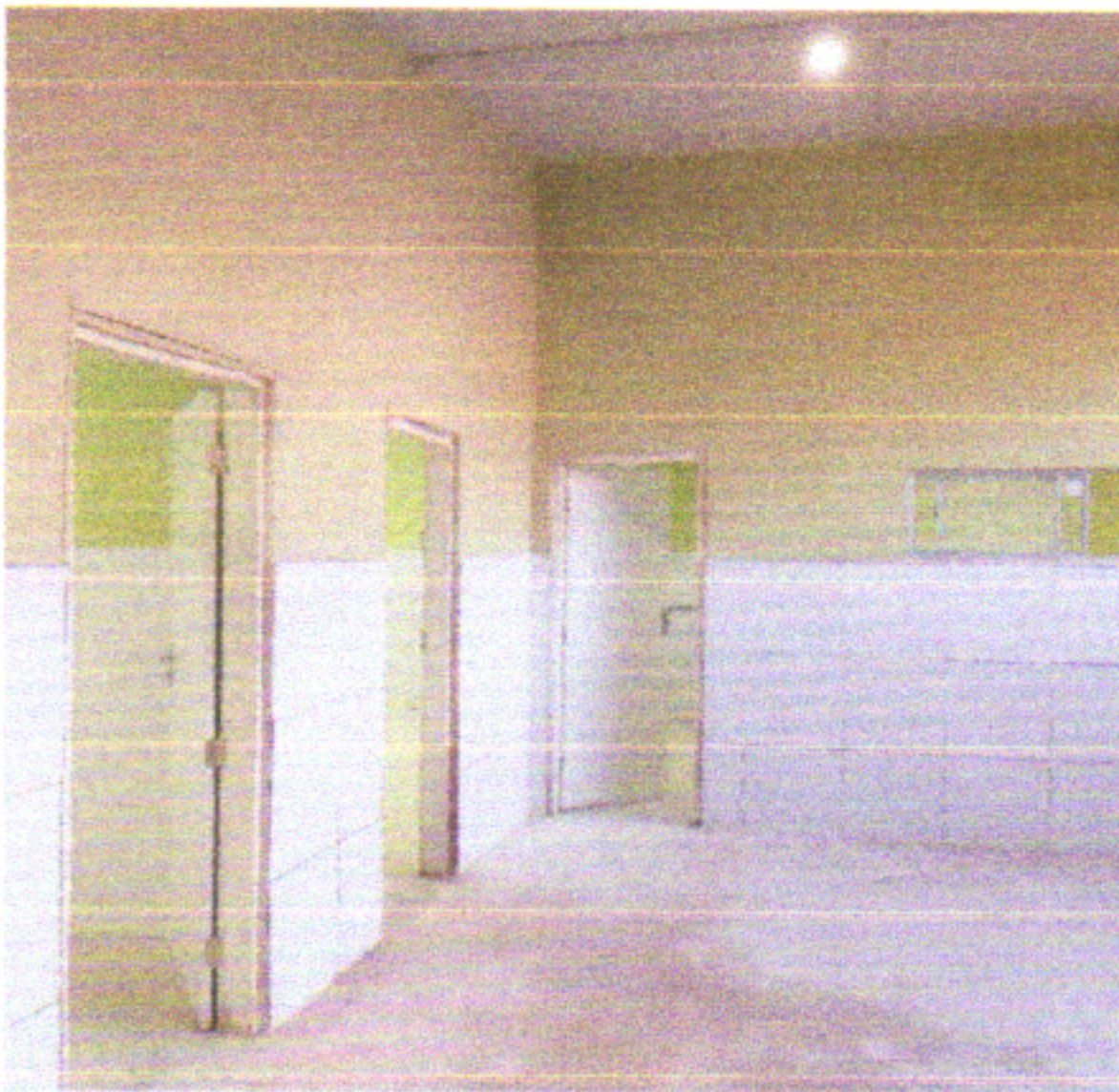
PINTURA DE PAREDES