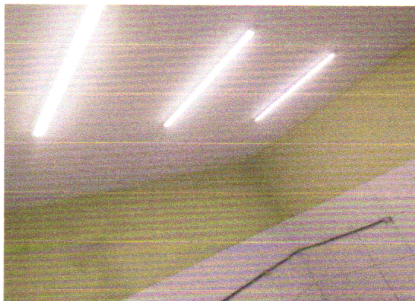
RETIRADA DAS LUMINÁRIAS E INSTALAÇÃO DE NOVAS