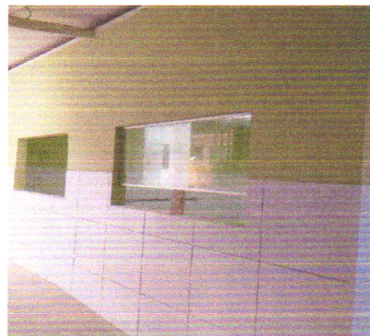
PINTURA DE PAREDES