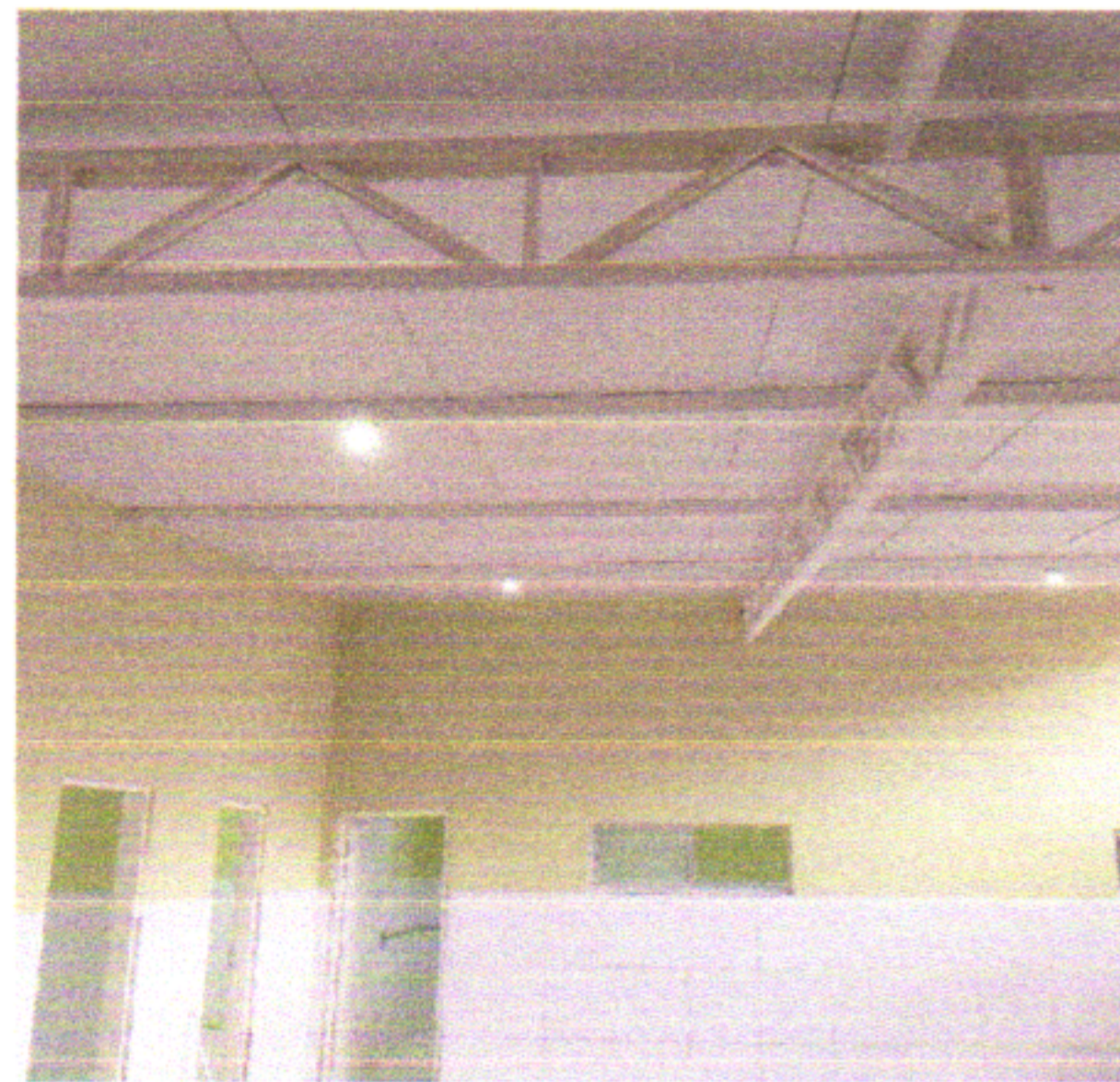
INSTALAÇÃO DE REFLETORES