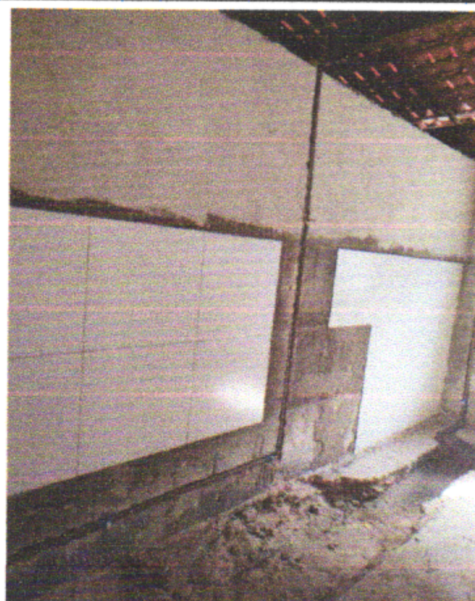
PONTO DE AGUA