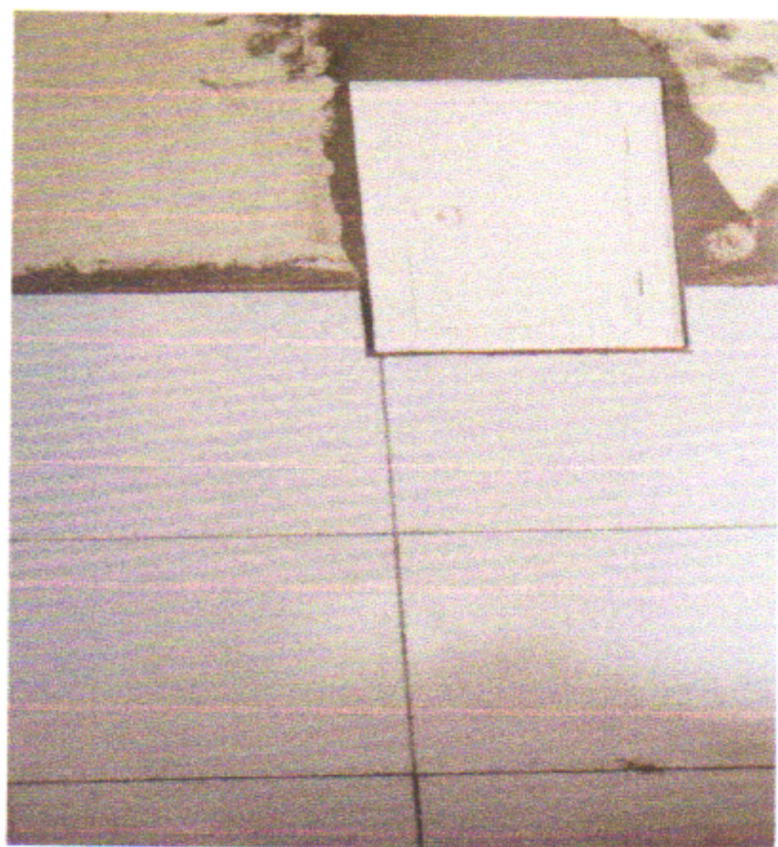
QUADRO DE ENERGIA