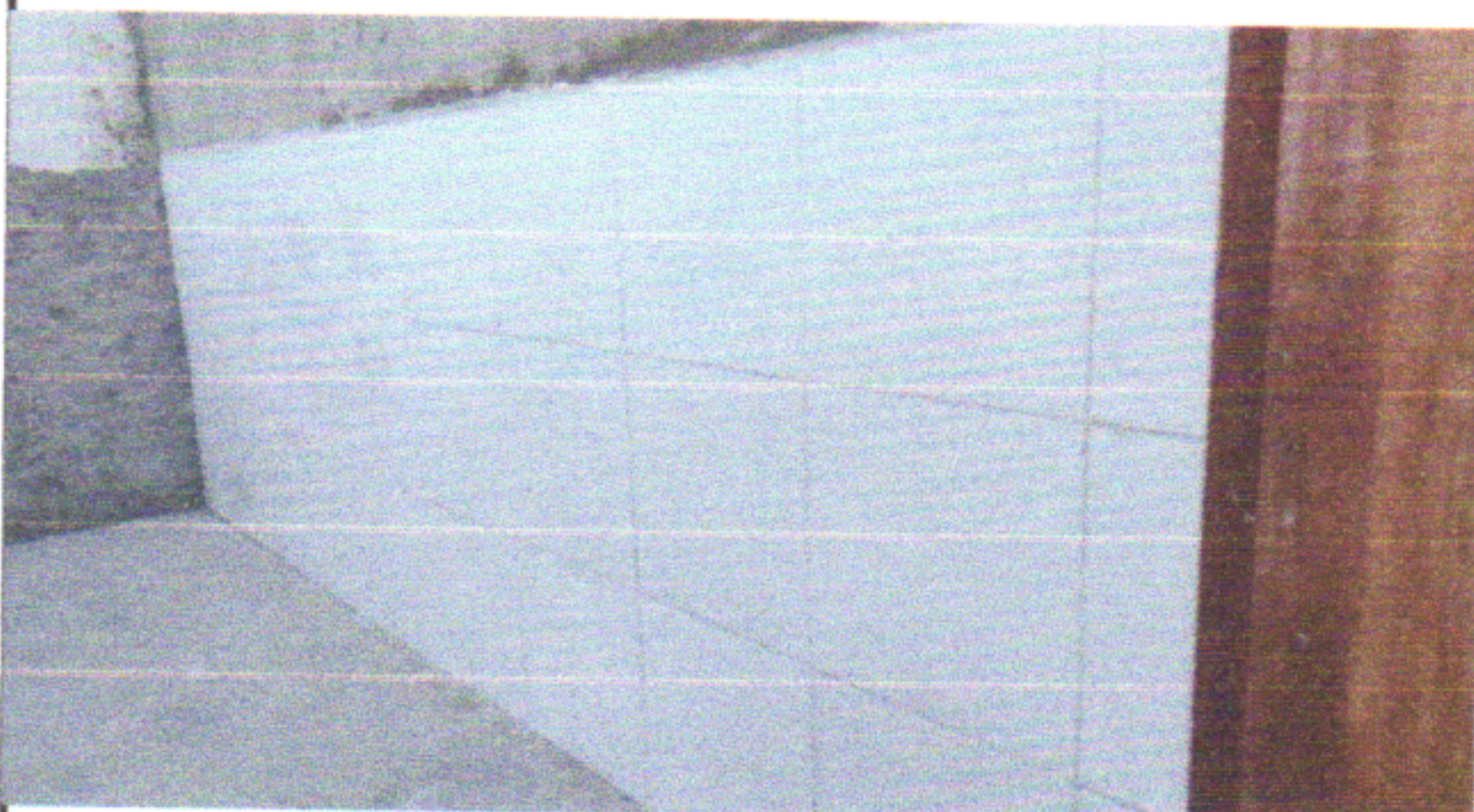
EMBOÇO E MASSA ÚNICA