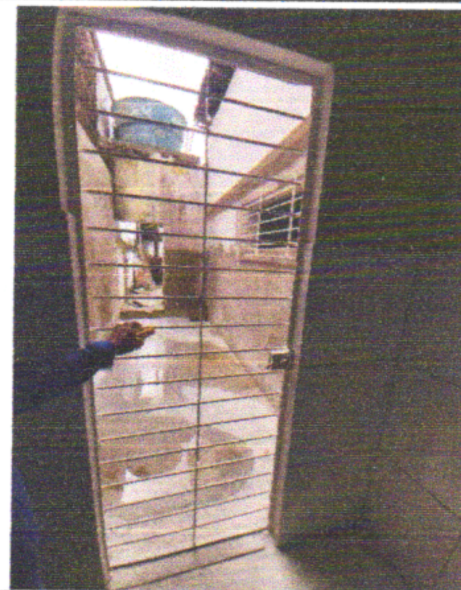
FORNECIMENTO E INSTALAÇÃO DE GRADE