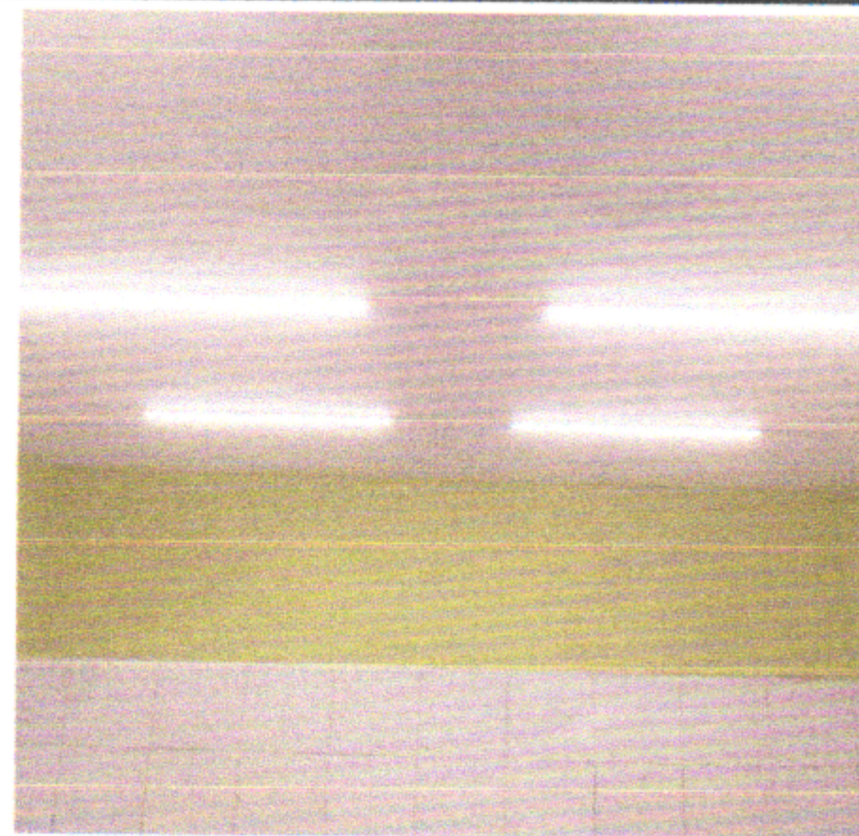
LUMINÁRIAS 120 CM