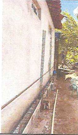
1..2.15 REMOÇÃO DE RAIZES