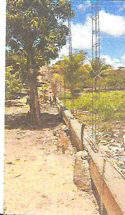
1.2.18 - CORTE DE ARVORE