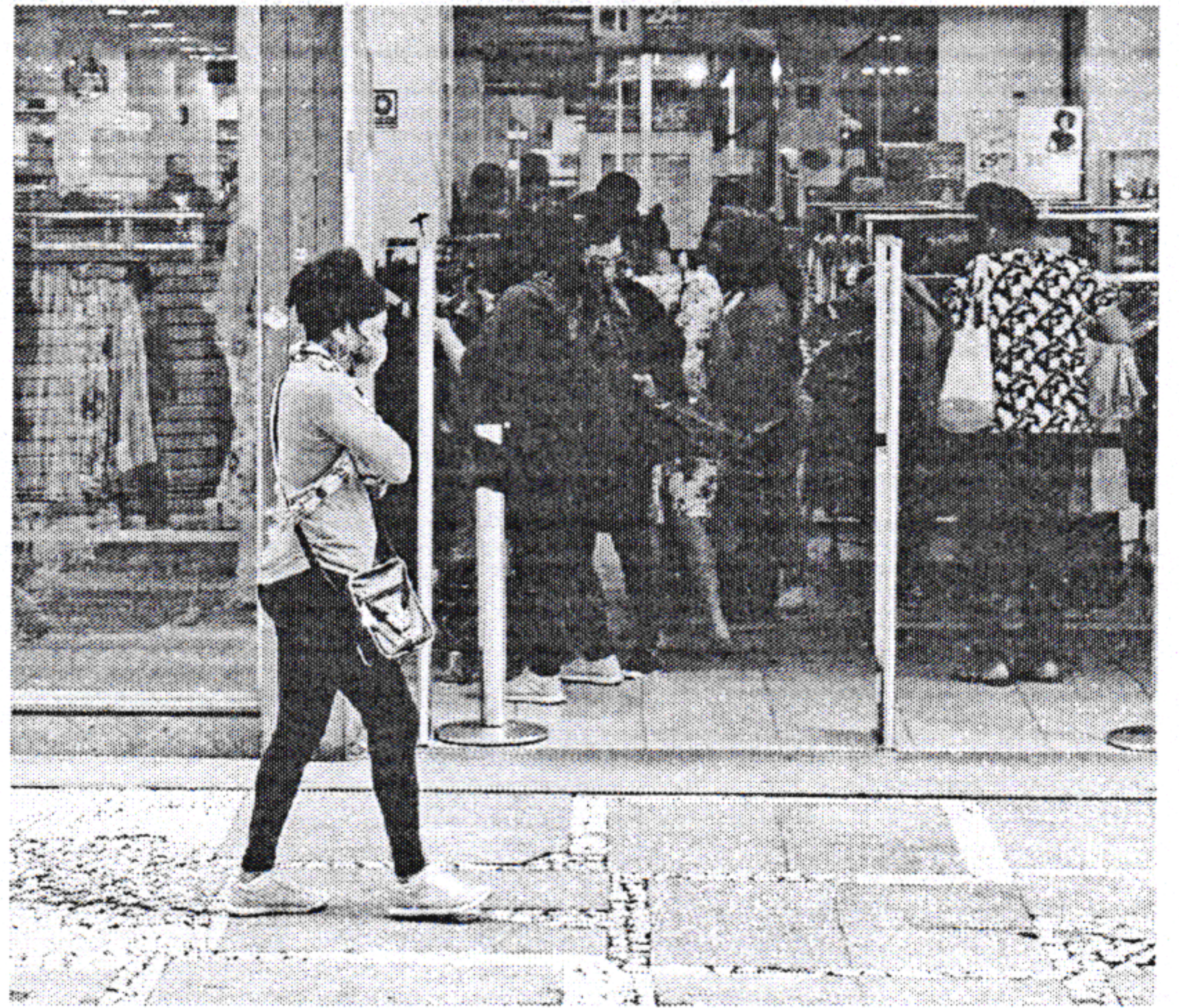
Confecções estão entre segmentos com alta nas vendas