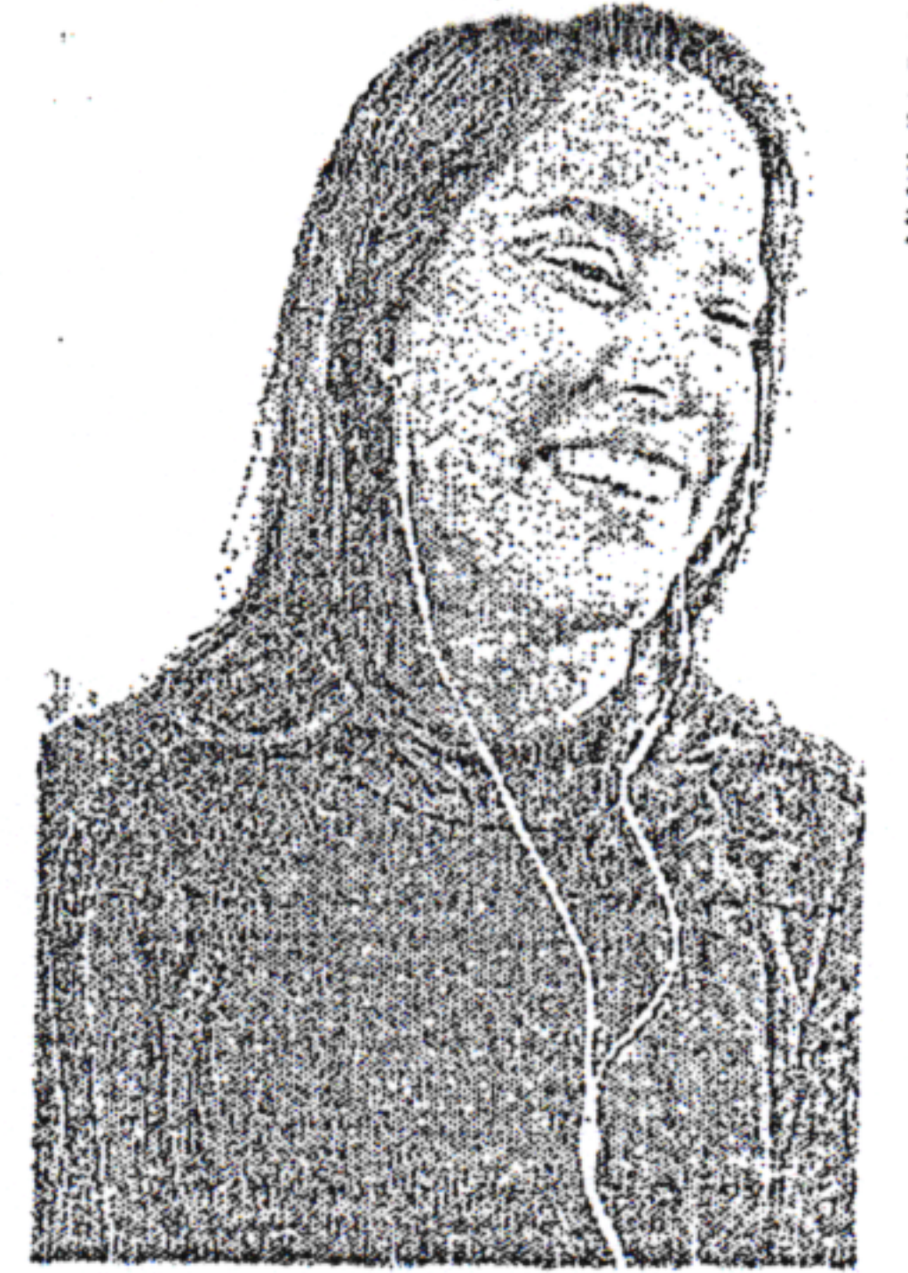
Raquel também fez críticas a Bolsonaro

a candidatura do presidente Lula ou do presidente Bolsonaro para tentar chegar ao segundo turno". No estado, o alvo da pré-candidata é o PSB. "A gente vive hoje um momento muito ruim e nós continuamos com o governador do PSB. Não é porque vai mudar presidente que o PSB vai fazer um governo melhor do que fez", disse. Na avaliação da tucana, Paulo Câmara conduz "a pior gestão da história de Pernambuco, que não consegue enxergar para além da próxima eleição", encerrou.