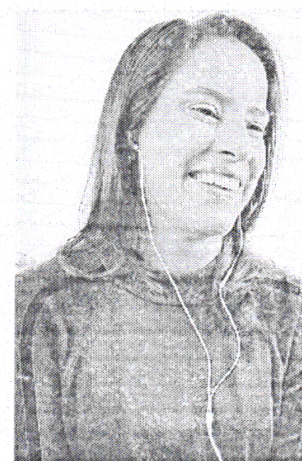
Raquel também fez críticas a Bolsonaro

a candidatura do presidente Lula ou do presidente Bolsonaro para tentar chegar ao segundo turno". No estado, o alvo da pré-candidata é o PSB. "A gente vive hoje um momento muito ruim e nós continuamos com o governador do PSB. Não é porque vai mudar presidente que o PSB vai fazer um governo melhor do que fez", disse. Na avaliação da tucana, Paulo Câmara conduziu "a pior gestão da história de Pernambuco, que não consegue enxergar para além da próxima eleição", encerrou.