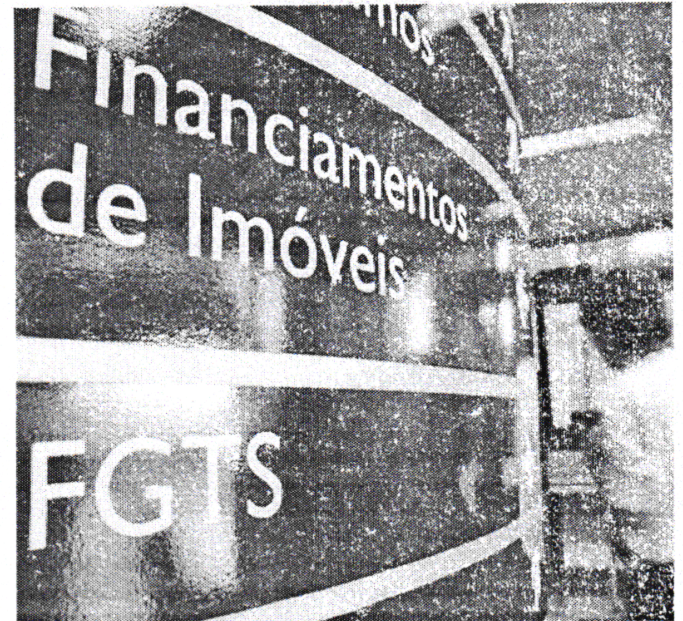
O valor do saque fica disponível até 15 de dezembro

Também ontem, Bolsonaro assinou decreto antecipando o pagamento do 13º dos aposentados e pensionistas do INSS. O governo estima que a medida injetará R$ 56,7 bilhões na economia. O pagamento da primeira parcela será de 25 de abril a 6 de maio, com as aposentadorias e pensões da competência de abril. E a segunda parcela, de 25 de maio a 7 de junho, com os benefícios relativos a maio.