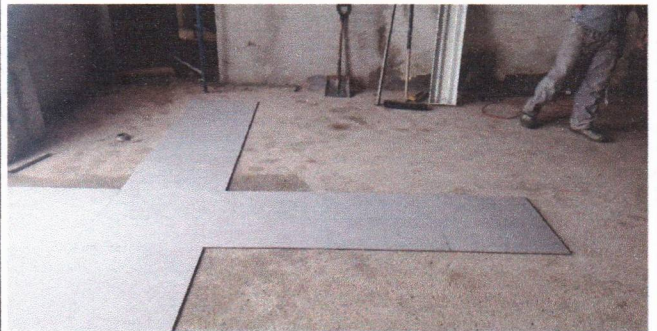
APLICAÇÃO DO REVESTIMENTO CERÂMICO EM PORCELANATO (PREFEITURA SEDE)