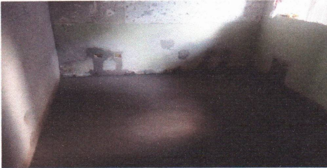
APLICAÇÃO DO CONTRAPISO (PREFEITURA SEDE)