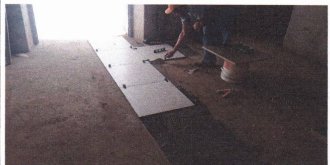
APLICAÇÃO DO REVESTIMENTO CERÂMICO EM PORCELANATO (PREFEITURA SEDE)