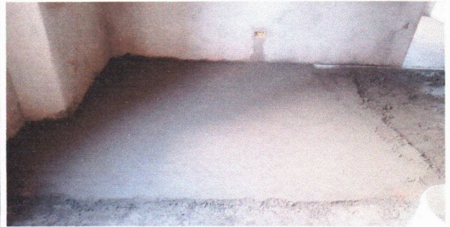
APLICAÇÃO DO CONTRAPISO (PREFEITURA SEDE)