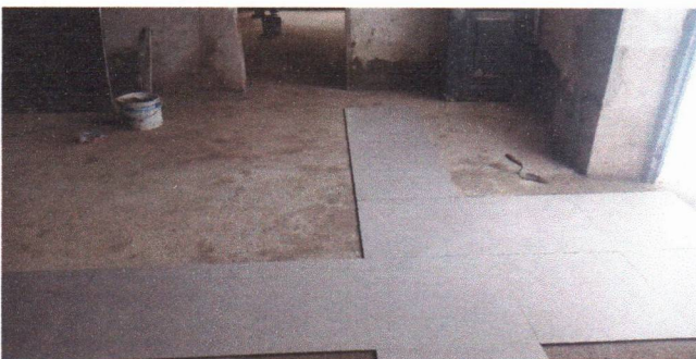
APLICAÇÃO DO REVESTIMENTO CERÂMICO EM PORCELANATO (PREFEITURA SEDE)