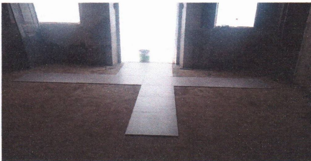
APLICAÇÃO DO REVESTIMENTO CERÂMICO EM PORCELANATO (PREFEITURA SEDE)